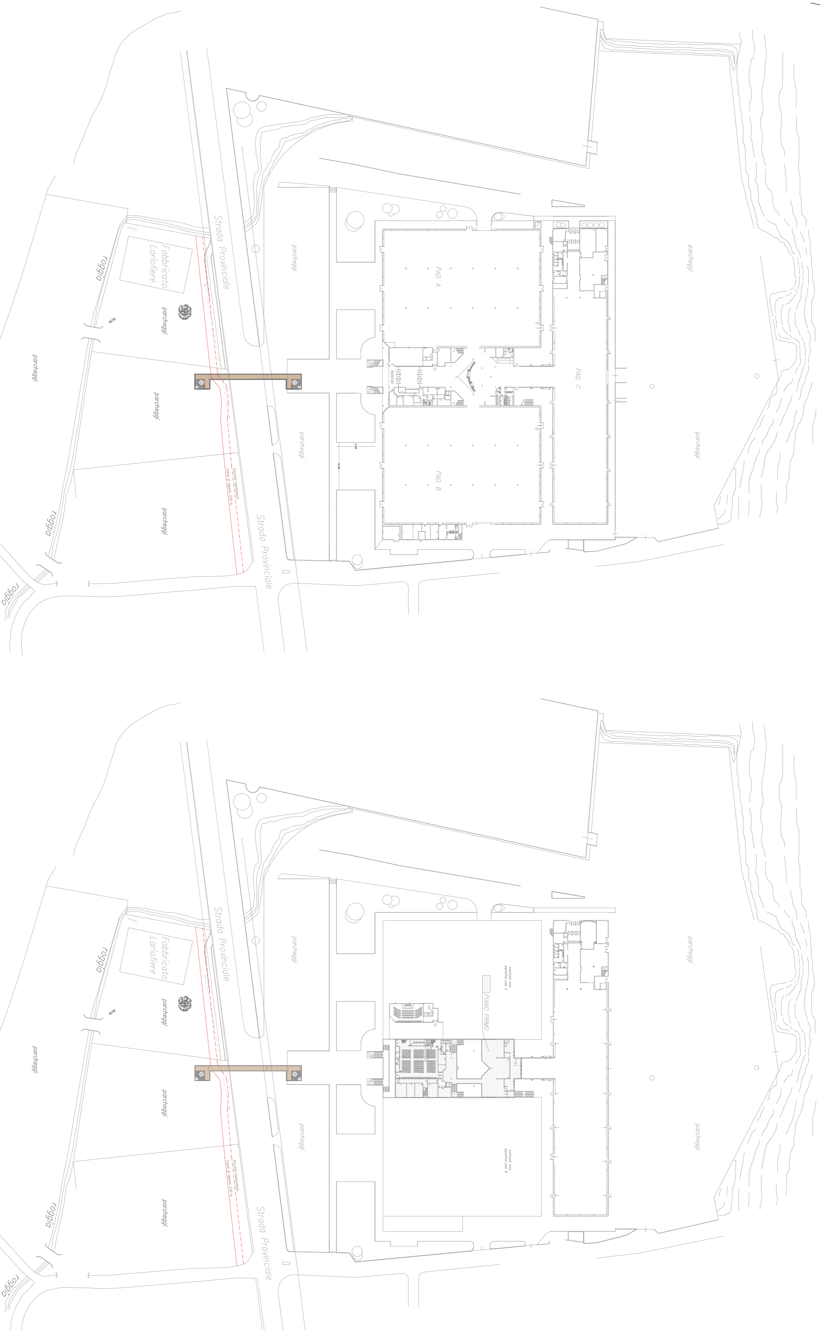
PLANIMETRIA GENERALE PIANO TERZO - SCALA 1:1.000 -